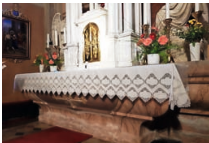
Največ čipk so všili v prt za glavni oltar, ki je velik več kot štiri metre.