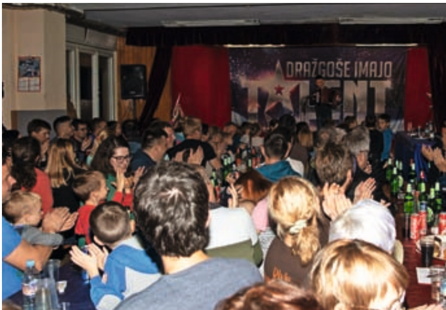
Vaška dvorana je pokala po šivih.