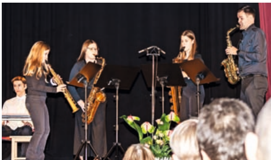
Proslavo so z glasbo obogatile učenke Glasbene šole Škofja Loka pod mentorstvom profesorjev.