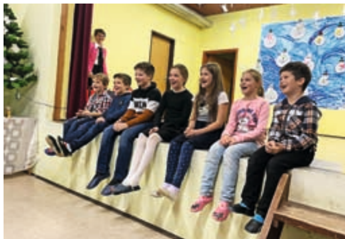
Učenci in učiteljice so pripravili pester program.