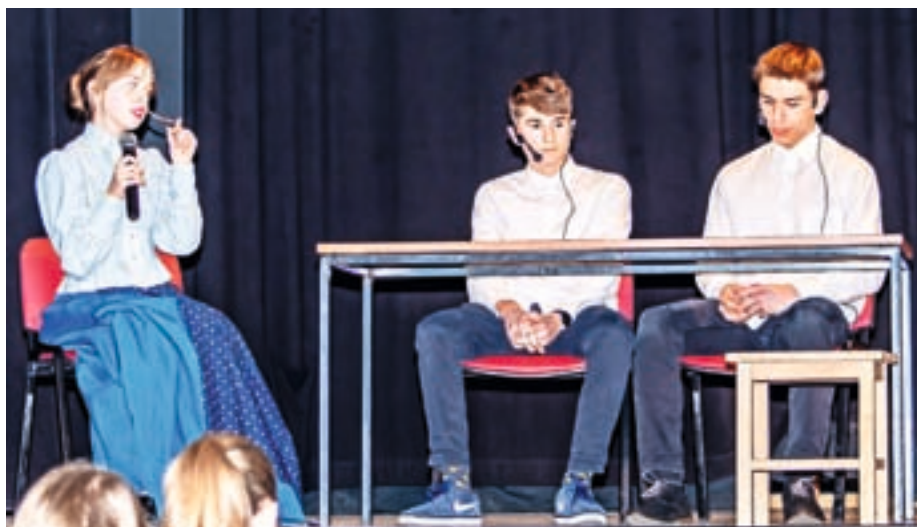
Skozi Prešernovo življenje so obiskovalce popeljali učenke in učenci Osnovne šole Železniki.