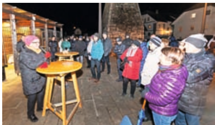
Muzejsko društvo Železniki je na Prešernov dan znova priredilo dogodek Pred plavžem mi pesem povej.