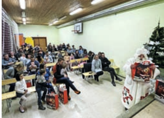
V Davči Dedek Mraz obdaruje otroke do vključno petega razreda. Tokrat jih je bilo 42.